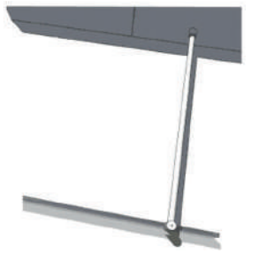
BARRA REFUERZO DOBLE FRONTAL 8-10 mm ACERO AISI 304 1000 mm Ø 14 mm F2 DOUBLE FRONT SHOWER ROD 8-10 mm STEEL AISI 304 1000 mm Ø 14 mm F2